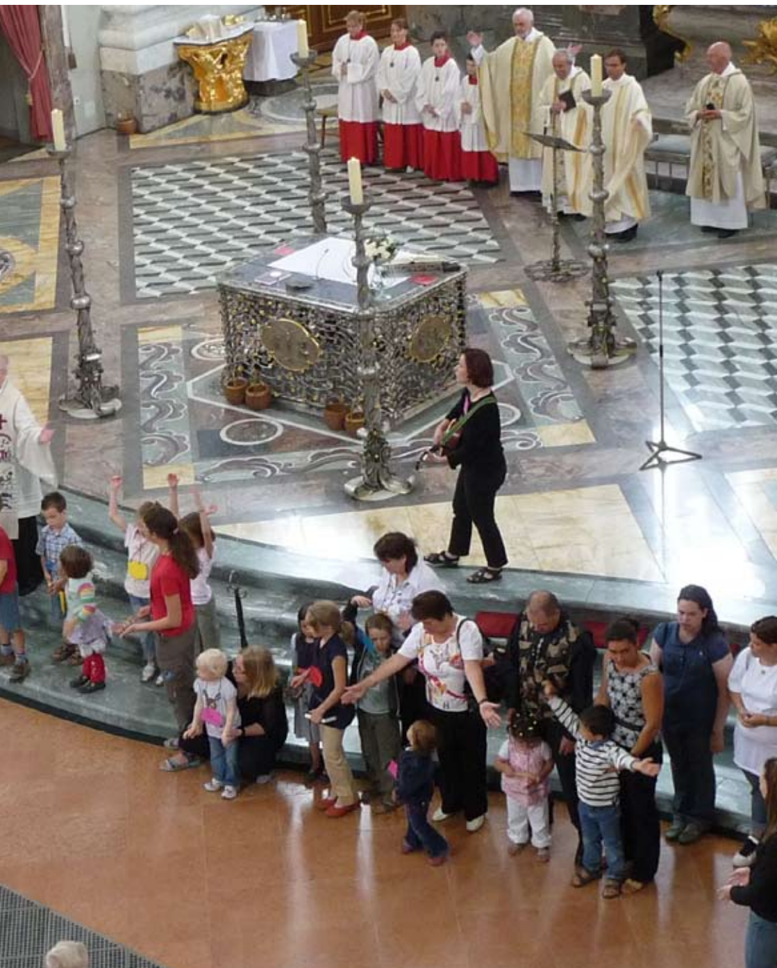
Die Kinder beim Patroziniumsfest der Jesuitenkirche am 20. Juli